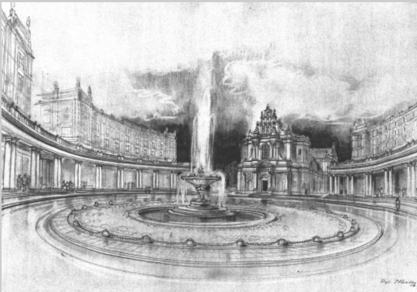
3. Wizja pl. Zbawiciela (1950 r.). Fontanna i kolumnada dookoła placu robi wrażenie, ale po dokładnym przyjrzeniu się rysunkowi można zauważyć niepraktyczność tej wizji – ul. Marszałkowska ma tylko jedno pasmo, nieobecny jest także ruch tramwajowy. Zwraca też uwagę brak wież kościoła Najświętszego Zbawiciela.

dawnej, nie może być poprawionym jedynie powtórzeniem przedwojennego zbiorowego prywatnych interesów kapitalistycznego społeczeństwa” – przekonywał Bierut.