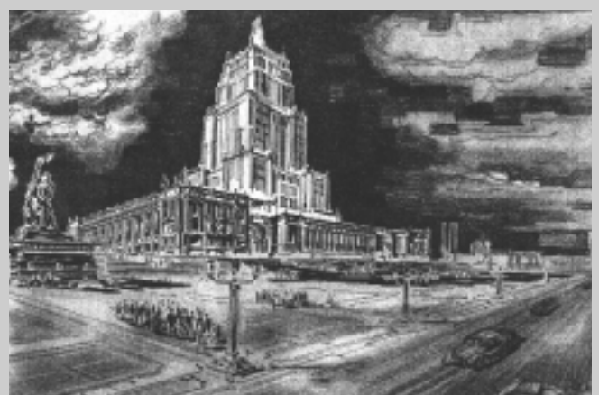
6. Wizja gmachu Pałacu Kultury i Nauki (1950 r.). Zrealizowany został w 1955 r. smuklejszy, ale bardziej rozległy projekt architektów radzieckich pod przewodnictwem Lwa Rudniewa. Według wspomnień Sigalina, to polscy architekci wymogli wysokość budynku, czemu Rudniew był przeciwny.

U podstaw załamania się socrealizmu leżała przyczyna zasadnicza: architektura została skrojona na „socjalistyczne społeczeństwo”, które nigdy nie istniało. Miała być re-