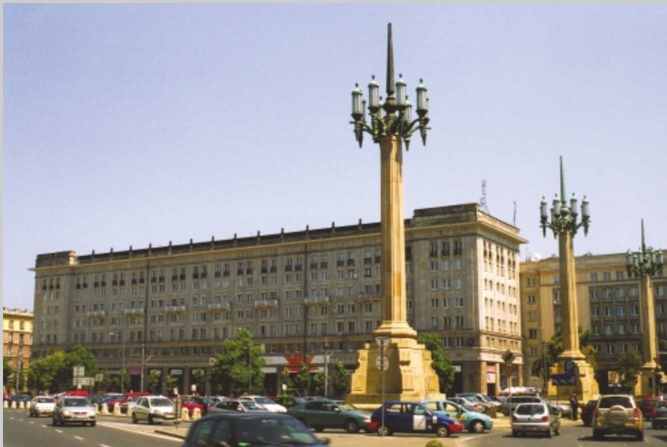
7. Plac Konstytucji i okalająca go Marszałkowska Dzielnica Mieszkaniowa ukazują najistotniejsze założenia socrealizmu. Rozległy plac wraz z szeroką ul. Marszałkowską miał służyć do defilad i manifestacji, a monumentalne bloki-palace, ozdobione propagandowymi mozaikami i płaskorzeźbami, były przeznaczone dla klasy robotniczej.

(ilustracje: 1-6 – wg Bolesław Bierut, „Sześćcioletni plan odbudowy Warszawy”, Warszawa 1950, fot. 7 – Stanisław Grzelachowski)