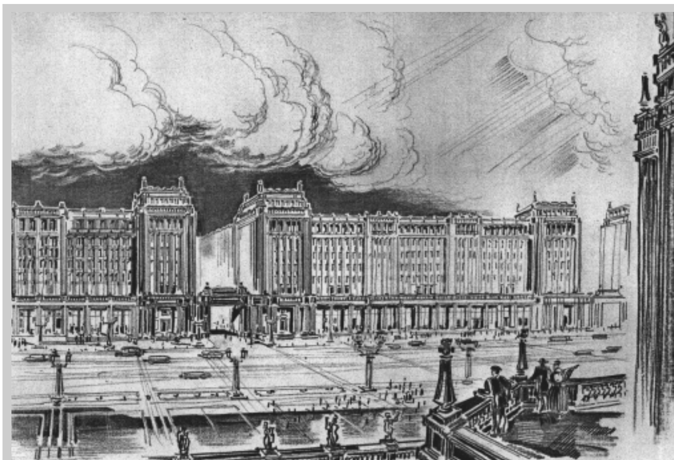
2. Socrealistyczna wizja ul. Marszałkowskiej, róg Chmielnej (1950 r.) nigdy nie doczekała się realizacji. Dopiero w latach siedemdziesiątych XX w. wybudowano Domy Towarowe „Sawa”, „Wars” i „Junior”.

W ramach tej walki o szczytne cele powiększono po 1945 r. hitlerowskie zniszczenia, rozbierając wiele zachowanych budynków, nieraz o wielkiej wartości. Zniszczenie zabytkowych kamienic nie było efektem ubocznym realizowania nowych inwestycji – było częścią nowego ładu, bez którego planowana przebudowa nie miałaby sensu. W ten sposób znikły eklektyczne, secesyjne i międzywojenne kamienice wzdłuż głównych ulic miasta. Dokonano tego całkowicie świadomie, gdyż był to jeden z priorytetów socrealizmu. „Nowa Warszawa nie może być powtórzeniem