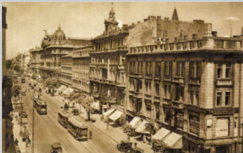
1. Zdjęcie przedwojennej ul. Marszałkowskiej (wg Warszawa 1945-1948 , Warszawa 1948). Oto „pstrokaty i kosmopolityczny obraz miasta kapitalistycznego” – tak komunistyczne kierownictwo oceniało wygląd przedwojennej Warszawy. Obiecywało zbudować nowe miasto i nadać mu „właściwy sens” i „właściwe piękno”.

To miała być Warszawa marzeń, miasto, do którego najlepszych i najpiękniejszych części miał wbiec uciskany do tej pory lud. Miasto zharmonizowane, o szerokich ulicach, wielkich placach, pełne światła i zieleni, miasto szczęśliwych ludzi, mieszkających w budynkach, z których każdy miał wyglądać jak pałac. Architekci odbudowujący Warszawę stanęli przed zadaniem, którego pozazdrościłby im każdy inny kolega po fachu. To oni mieli nadać kształt najważniejszemu miastu w Polsce, wykroić całkiem nowy, idealny plan, zapłacić je budynkami o niespotykanej dotychczas treści i formie. Odpowiedzialność twórców nowej stolicy była tym większa, że Warszawa nie miała być miastem samym dla siebie. Miała to być stolica państwa socjalistycznego, która „promieniując i oddziaływując na cały kraj przyspieszy