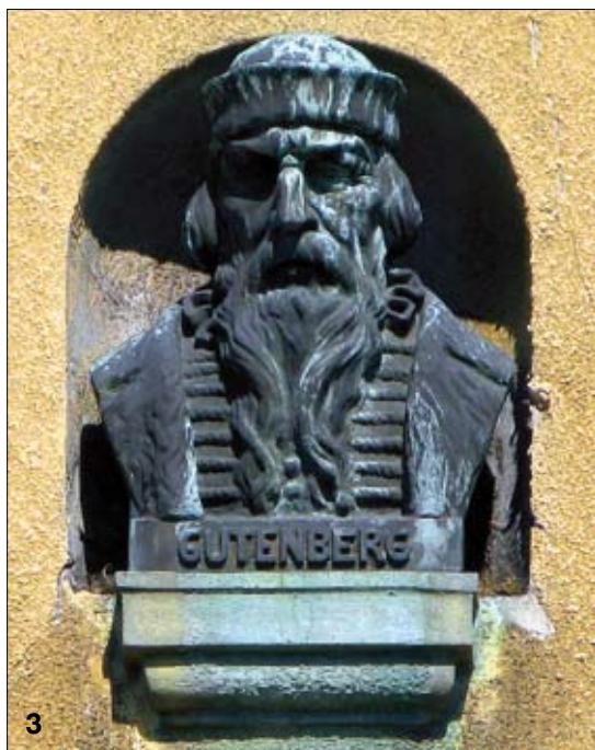
1. Kamienica w Alei Najświętszej Marii Panny w Częstochowie